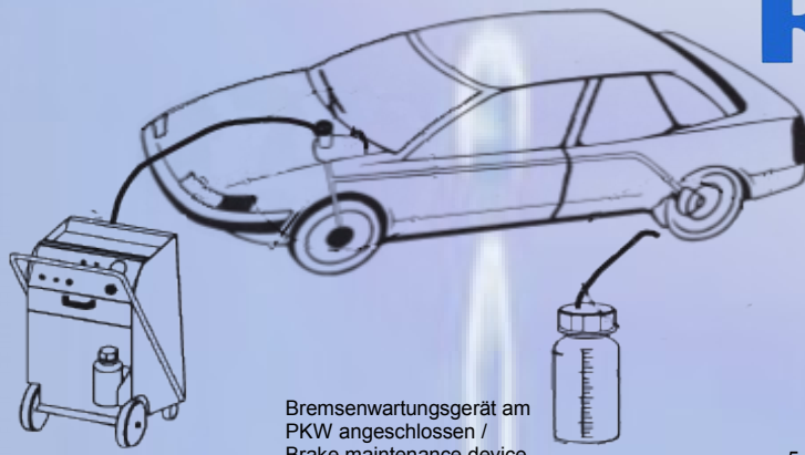
Bremsenwartungsgerät am PKW angeschlossen / Brake maintenance device connected to the passenger car