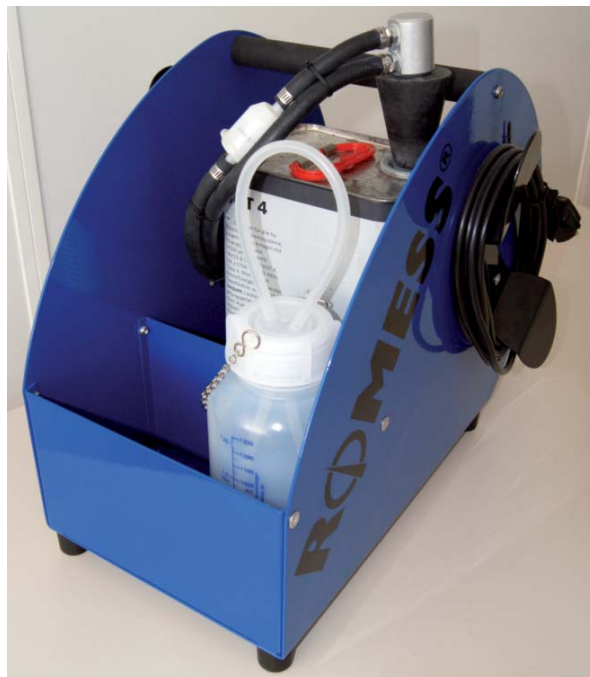
Très demandé au niveau mondial: Le BW 1408 T de ROMESS un appareil puissant en tant que bon marché mobile pour le service des freins.

particules de saleté les plus petites du système de freinage et permet ainsi une ventilation complète. Le niveau de remplissage ainsi que la pression de travail sont contrôlés en continu. En cas d'un conteneur ou bien d'un réservoir vide le système hydraulique est débranché et l'affichage du niveau reste