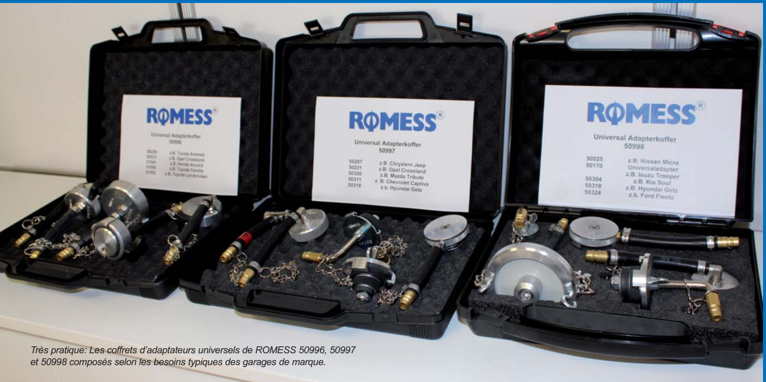
Très pratique: Les coffrets d'adaptateurs universels de ROMESS 50996, 50997 et 50998 composés selon les besoins typiques des garages de marque.

Aucun fournisseur n'offre ceci: ROMESS offre actuellement environ 230 adaptateurs pour les garages d'automobiles. Cette énorme variété est une caractéristique unique laquelle démarque le leader en technologie du marché dans le secteur maintenance de freins.