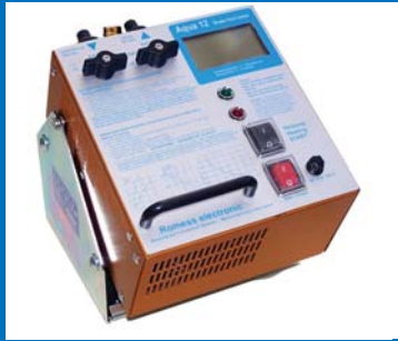
L'Aqua 12 Digi fonctionne de façon hautement précise.