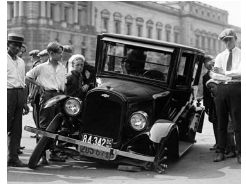
Antérieurement on n'attachait pas beaucoup d'attention sur des freins qui fonctionnait bien.

Aujourd'hui ce n'est pas imaginable – le frein appartient aux systèmes de sécurité les plus importants d'automobile. En raison de cela on l'a toujours développé de manière très intense. Seulement quatre ans après la présentation de l'automobile par Carl Benz, l'ingénieur anglais, Frederick Lanchester développait le frein à disque pour lequel il recevait en 1902 un brevet. Vers l'an 1920 on conduisait des automobiles avec le frein mécanique à quatre roues. L'automobiliste a dû générer lui-même la force de freinage. Peu de temps après les freins hydrauliques à tambour ont été développés. Jaguar lançait la première automobile avec des freins à disque. La première