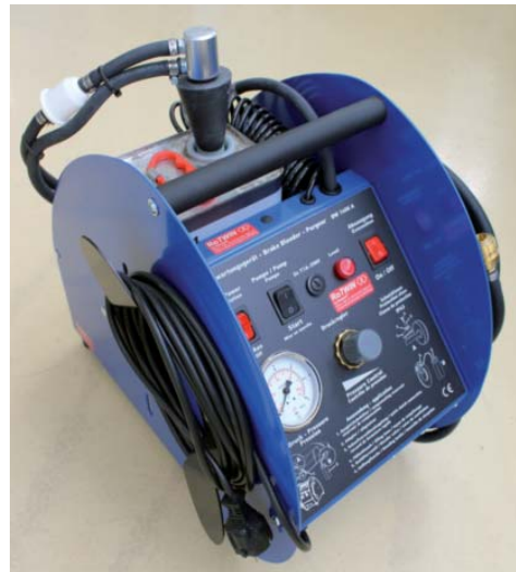
BW 1408 fren bakımı konusunda mobil kullanımın "gizli silahıdır" -kullanışlı ve güçlü.