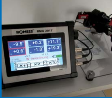
Automechanika da yoğun bir ilgi gördü: Şaft mafsal açısı ölçme cihazı RMG 2017.

BW 1408 HY cihazı özellikle hidropnömatik vites ve kavrama sistemi bulunan ticari araçlarda kullanılması için donatılmıştır. Sıvı değişiminde ROMESS markasının HY-cihazlarıyla baloncuksuz iş çıkartılır.