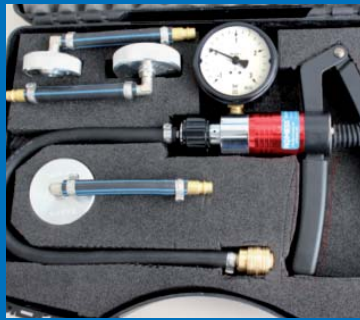
Çanta içerisinde pratik set: ROMESS'in Radyatör testeri 4000 artı Adaptör.

Radyatör mü kaçırıyor? ROMESS'in Radyatör testeri 4000 ile bu kolayca tespit edilebilir. Kendisi basınç ve vakum ölçümü yapar ve uygun adaptör ile birlikte pratik taşıma çantası içerisinde gönderilmektedir.