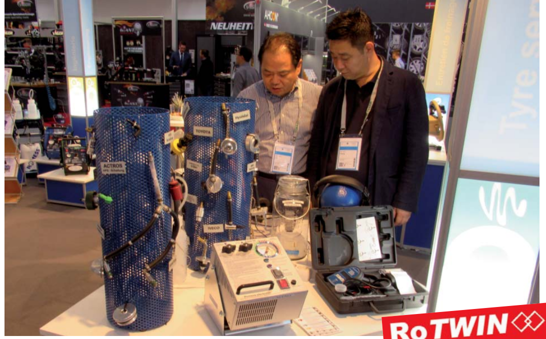
Frankfurt'taki Automechanika da Dünya'ya yalnızca ROMESS'in RoTWIN-Cihazları sunulmadı, aynı zamanda ROMESS'i rakiplerinden ayıran geniş aksesuar seçenekleri de ziyaretçilerle buluşturuldu.