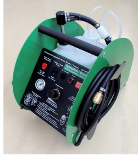
Piyasada yeni: ROMESS'in Hidrolik cihazı BW1408 HY, aynı şekilde patentli RoTWIN teknolojisine ile donatılmıştır.

BW1408 çok kullanışlı ve müthiş güçlü. Çünkü içerisinde RoTWIN jenerasyonunun hidrolik sistemini barındırıyor. Sistemin zekice çalışan teknolojik prensipi dünya çapında patentlerle korunmakta ve modern fren sistemlerinin içerisindeki havanın dahi tamamen alınmasını mümkün kılıyor. Sıradan, basit servis cihazları bunu başaramamakta. Uzman alan dergilerdeki de dahil bağımsız testler bunu kanıtlamıştır. BW 1408 çekici bir tasarımla birlikte kade-