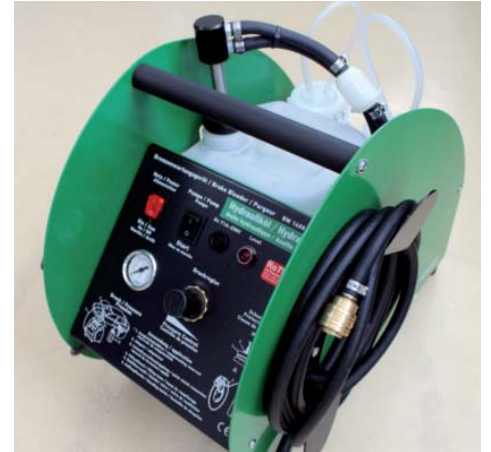
Nouveauté sur le marché: L'appareil hydraulique BW 1408 Hy de ROMESS, équipé également avec la technologie RoTWIN brevetée.

Les appareils de service traditionnels n'y sont pas capables. Des tests indépendants effectués aussi de la part de la presse spécialisée ont montré ce fait. Le BW 1408 a un design attrayant, dispose d'un réglage de pression