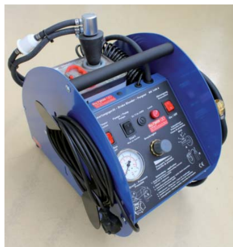
Le BW 1408 est „l'arme secrète” pour l'utilisation mobile en ce qui concerne la maintenance de freins – pratique et puissant

Il va de soi que la version HY dispose également de ce type d'affichage. En effet, le modèle pour changer le liquide hydraulique par exemple dans les véhicules utilitaires ainsi que terrestre, dans les machines de chantier et dans les installations industrielles se base quand même sur la technologie de pointe RoTWIN: La pompe à piston oscillant génère une pression d'écoulement beaucoup plus haute pour ventilations par rapport à d'autres systèmes conventionnels. Le BW 1408 HY a été développé spécialement pour l'application auprès des véhicules utilitaires, lesquels sont équipés avec un système de commande et d'embrayage hydro pneumatique. En utilisant les appareils HY de ROMESS on peut effectuer le changement du liquide sans aucune formation des bulles.