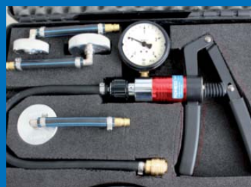
Set pratique dans le coffret : Le testeur de radiateur 4000 de ROMESS adaptateur inclus.

Le radiateur a une fuite ? Avec le testeur de radiateur 4000 de ROMESS on le peut découvrir immédiatement. Il mesure pression et vacuum et est fourni dans un coffret pratique avec les adaptateurs correspondants.