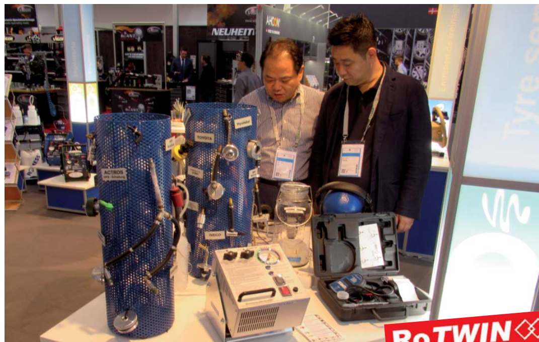
Non seulement les appareils RoTWIN de ROMESS étaient dans le point de mire des clients du monde entier sur le stand à l'Automechanika, mais aussi la vaste gamme des accessoires s'est profilée face à la concurrence.

RoTWIN La nouvelle référence dans la maintenance de freins