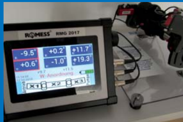
Très recherché sur l'Automechanika : L'instrument pour mesurer l'arbre de transmission- l'angle de flambage RMG 2017.