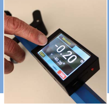
Sık renkli ekranı ve dokunmatik özelliğiyle RNW 2009.

stille daha okunaklı olarak göstermekte. Portföye yeni katılan ise RoTWIN jenerasyonunun yeni fren bakım cihazı S 16 dir (teknik bilgileri karsi sayfada bulabilirsiniz). Dis görünüş itibariyle ROMESS portföyünün bestselleri S 15 ile aynı. Donanım olarak ise içerisinde iki adet silindir pompa entegredir ve daha basit bir depo göstermesine sahip. Bunun dışında bütün elektronik kısım cihazın üst yarısında bulunmakta. Bu hem montajı kolaylaştırıyor, hem de cihaz servisinin isini. Elektronik yeniliklerden fren sıvısı testerleri Aqua 10 ve Aqua 12 Digital da nasiplerini aldılar. Kaynama derecelerinin isı ölçümleri şimdi daha da kesin sonuçlara ulaşmakta. Aqua cihazı her iki donanım ile da açıkara lider, çünkü piyasada bulunan rakip firma testerlerine kıyasla içerisinde ölçüm odacığı bulunan ve bu nedenle hava basıncı ve nem dalgalarından etkilenmeyen tek testerdir.