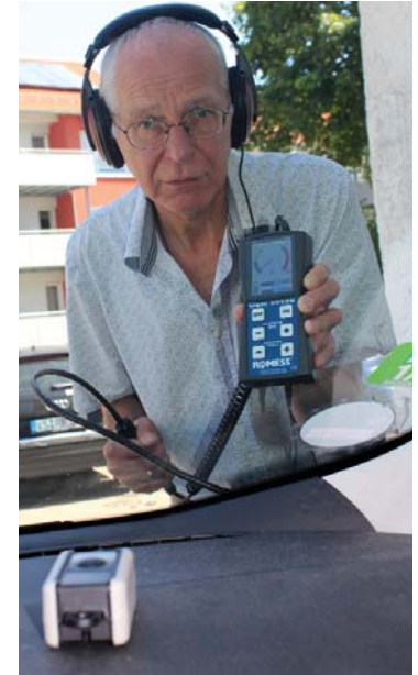
Araç içerisinde (önde) modüle eden vericili Ultrases sızıntı bulucu USM20128 .