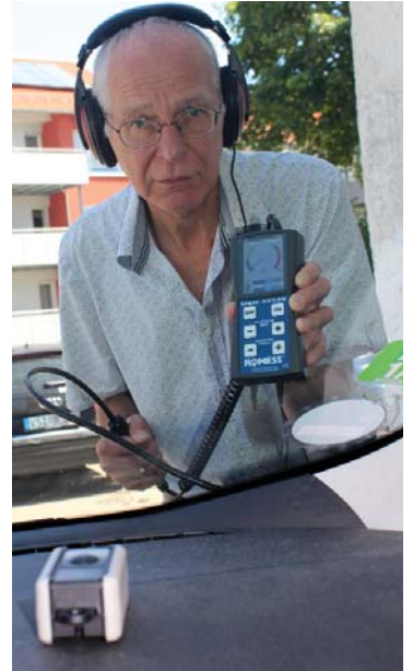
Araç içerisinde (önde) modüle eden vericili Ultras ses sızıntı bulucu USM20128 .