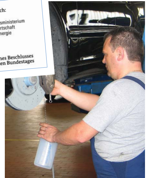
Yalnızca RoTWIN-jenerasyonu bir cihaz ile günümüz modern araçların fren sistemleri tamamen havadan arındırılabilir. Sebebi ise iki adet Pompanın gücüdür (asagıda).