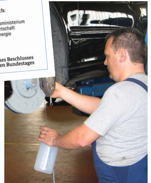
Yalnızca RoTWIN-jenerasyonu bir cihaz ile günümüz modern araçların fren sistemleri tamamen havadan arındırılabilir. Sebebi ise iki adet Pompanın gücüdür (asagıda).