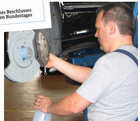
C'est seulement avec un purgeur de freins de la génération RoTWIN qu'on peut ventiler complètement des systèmes de freinage modernes. La raison en est dans la puissance des deux pompes (au-dessous).