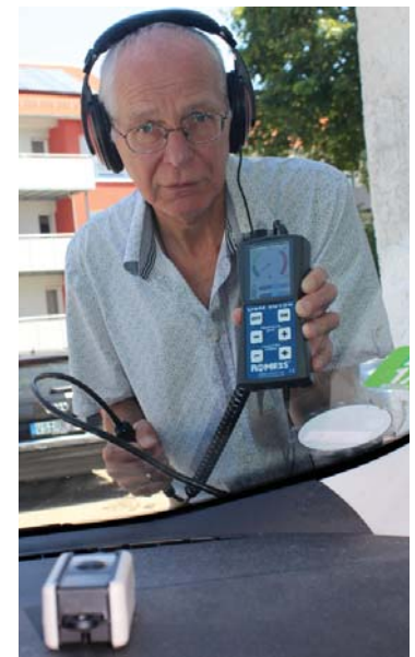
Le détecteur de fuites USM 20128 avec transmetteur modulé (devant) dans l'intérieur du véhicule.