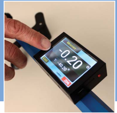
RNW 2009 avec grand écran en couleur à touches.

Il y a aussi une nouvelle électronique dans les testeurs du liquide de freins Aqua 10 et Aqua 12 digital. La mesure de température du point d'ébullition est effectuée en manière encore plus précise. Les deux versions de l'Aqua sont inégales, car il s'agit des seuls testeurs sur le marché lesquels sont équipés avec une cellule de mesure fermée. Par conséquent nos instruments ne sont pas du tout influencés des variations de pression d'air et d'humidité par rapport aux appareils de notre concurrence.