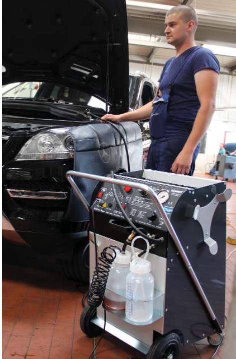
RoTWIN jenerasyonu bir cihaz tamirhanede kullanılırken: Yüksek talepleri yerine getirmekte, çünkü modern fren sistemlerini bile tamamen havadan arındırabilmektedir.

Aynen böyle görülmeli. Rakiplerimizin sunduğu cihazlar gibi, daha az performanslı bir ürünün kullanımında, modern araçlarda "yumusak frenler" söz konusu olabiliyor. Araç sürücüsü bunu hemen fark eder ve şikayette bulunur - bir kez, iki kez, ve sürekli. Veya cezai yükümlülükler nedeniyle tamirhane için çok daha kötü de olabilir. Frenlerin etkisi yetersiz olduğundan kaza yapabilir. İşte o zaman tam değer. Müsterisinin hayatından sorumlu olanlar, yanlış yerde tasarruf yapmamalıdır.