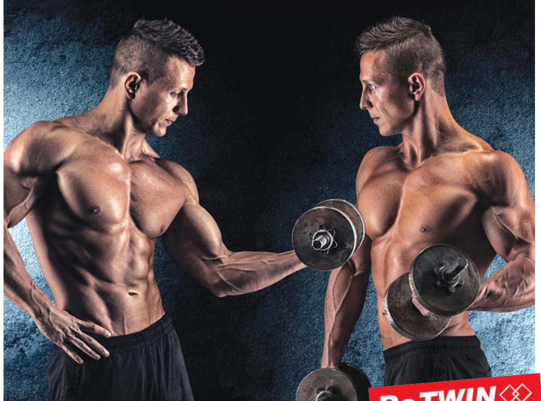
ROMESS, çitayı yükselten yeni fren bakım cihazları RoTWIN- jenerasyonunun reklamını bu iki güçlü kişiyle yapmakta. Neden?