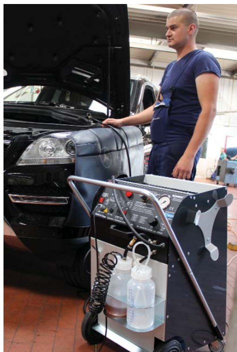
Un appareil de la génération RoTWIN dans le garage d'automobiles: Ils répondent aux plus hautes exigences, car il est aussi capable de ventiler complètement même des systèmes de freinage les plus modernes.

Il faut le voir ainsi : Si on utilise un appareil moins puissant comme fourni par nos concurrents, en cas de voitures modernes "des freins mous" sont possible. L'automobiliste note ceci dans un instant et réclame - une fois, deux fois, sans cesse. Ou bien, pour des raisons de responsabilité: Beaucoup pire est naturellement pour le garage d'automobiles, le client a un accident, car l'effet de freinage n'est pas suffisant. Si on est responsable pour la vie de ses clients, on ne doit pas faire des économies de bouts de chandelles.