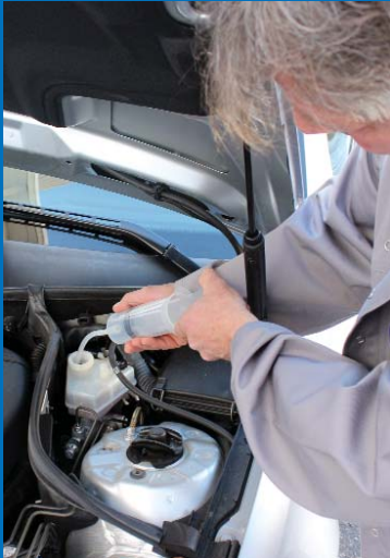
Le réservoir est vidé dans un instant.