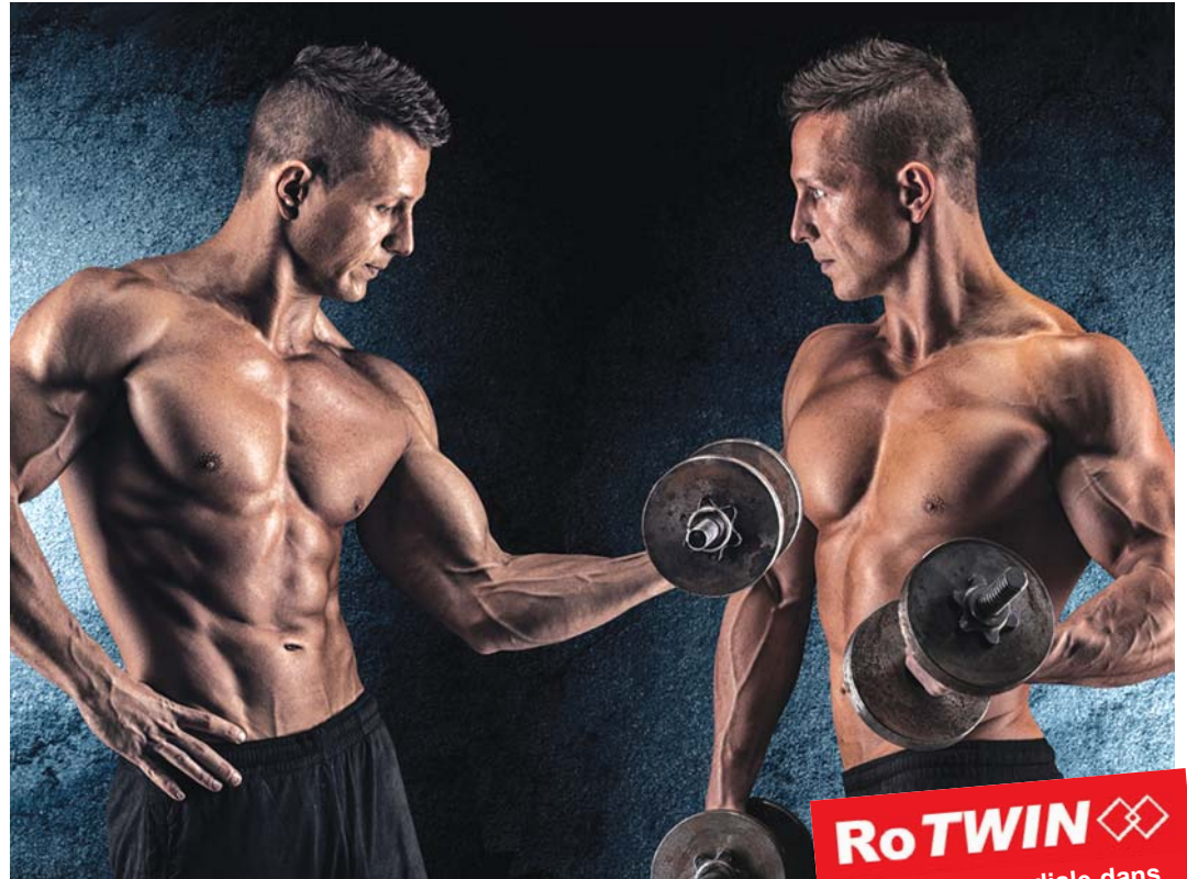
ROMESS fait de la publicité avec ces deux forts hommes pour les purgeurs de freins de la nouvelle génération RoTWIN laquelle établit de nouveaux critères. Pourquoi?

Amusez-vous bien en lisant! Votre Werner Rogg