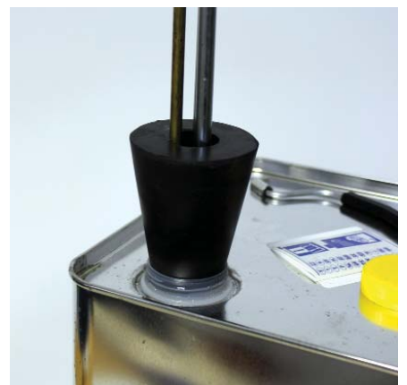
Riskant: Mitbewerber liefern einen einfachen, billigen Gummikeil, der meist das Gebinde nicht dicht verschließt, sodass Luft eindringen kann.