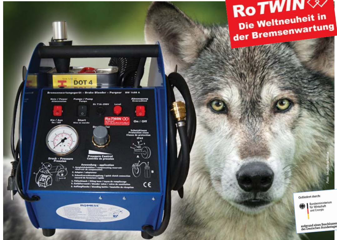
Wer das mobile Bremsenwartungsgerät BW 1408 A RoTWIN sieht, neigt dazu, es völlig zu unterschätzen. Im kompakten Gehäuse steckt mit der RoTWIN-Technologie die ungebändigte Kraft der Doppelhubkolbenpumpe.