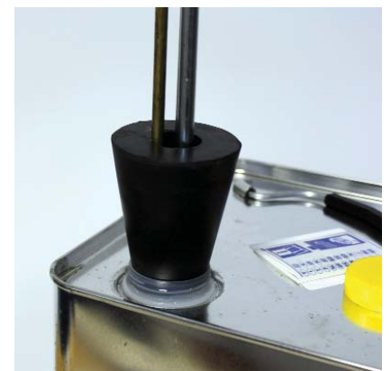
Pericoloso: I concorrenti forniscono una bietta di gomma a basso prezzo, la quale non chiude sempre bene il contenitore, in modo che l'aria possa entrare.