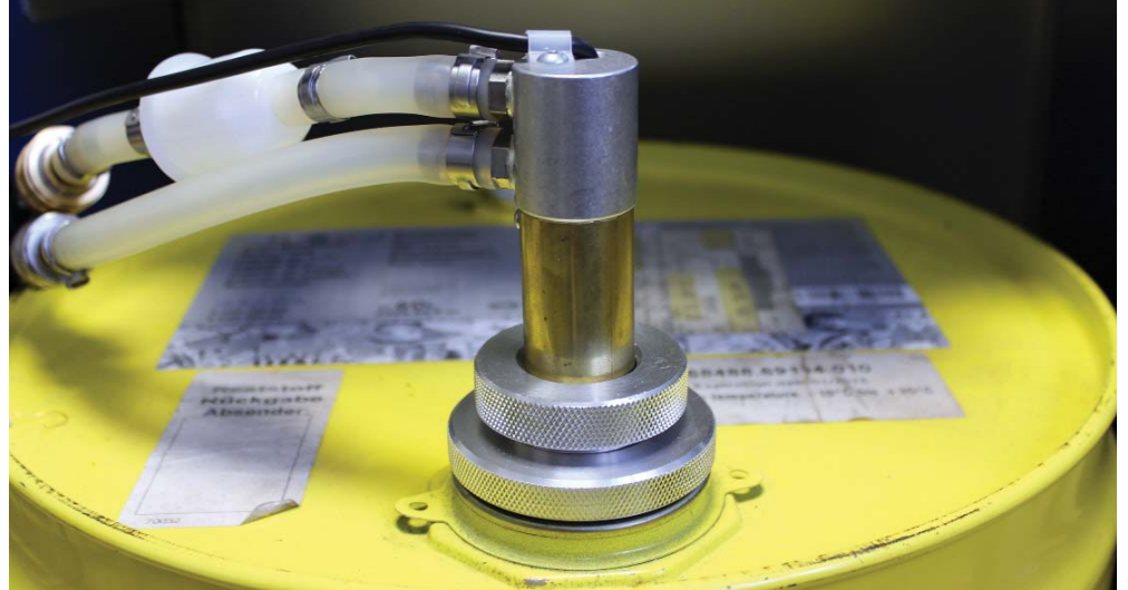
Così lavora ROMESS. Una solida chiusura a vite con due guarnizioni di gomma impedisce l'invecchiamento del liquido freni nel caso di grandi serbatoi. Per i serbatoi di piccole dimensioni ROMESS fornisce anche una chiusura in metallo di alta qualità. Il cono in alluminio con scanalature (centro) è avvitato e chiude in modo ottimale il serbatoio.

La maggior parte dei liquidi freni utilizzati sono igroscopici e quindi hanno la qualità di legare l'umidità dell'aria ambientale. Tale umidità, spesso sotto forma di vapore acqueo, diffonde attraverso giunti e tubi nel sistema di frenatura incapsulato. Ciò aumenta il rischio di un incidente, perché le particelle d'acqua nel liquido freni abbassano il punto di ebollizione e quindi anche la sicurezza di funzionamento del sistema di frenatura.