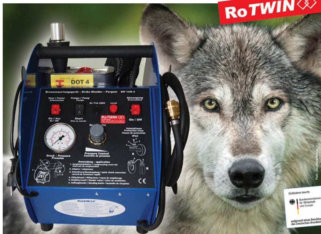
Chi vede il portatile apparecchio di manutenzione freni BW 1408 RoTWIN tende a sottovalutarlo. Nella custodia compatta è la forza indomata di una pompa a doppio pistone.