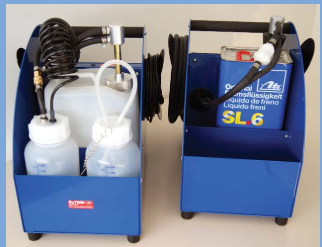
È praticissimo: Il BW 1408 RoTWIN trasporta il liquido dei freni da un contenitore di cinque litri convenzionale (destra), così come anche da un contenitore trasparente, il quale si utilizza con piccoli contenitori di liquido freni.

Il BW 1408 RoTWIN è la soluzione ideale per le officine d'auto con una piccola quantità di cambi di liquido freni, come anche per le aziende di veicoli commerciali, compagnie di autobus, concessionari d'auto, soccorsi stradali e anche utenti privati, che richiedono una tecnologia avanzata. È anche nello sport automobilistico, dove spesso si usano piccoli serbatoi, che il nostro piccolo BW 1408 A RoTWIN è la soluzione ideale.