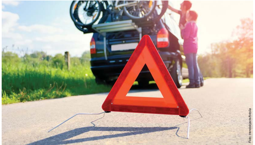
Qui veut exclure des mauvaises surprises pendant le voyage en vacances, doit faire encore un service de freins avant. De ce fait profitent aussi les garages d'automobiles. Au moins s'ils utilisent des appareils de service éprouvés.