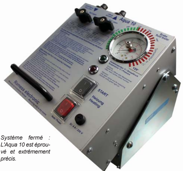
Système fermé : L'Aqua 10 est éprouvé et extrêmement précis.

Ce principe de fonctionnement des testeurs de ROMESS est aussi un grand avantage à l'utilisateur dans l'atelier : Car le processus de mesure, c.à.d. faire chauffer le liquide de freins, s'effectue dans une chambre fermée, le contact ou bien l'inspiration de vapeur est impossible.