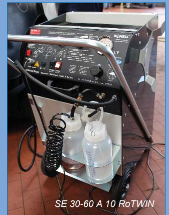
SE 30-60 A 10 RoTWIN

Beaucoup de décideurs de garage prennent avant tout un prix attrayant en considération. Même ici les appareils supérieurs de la génération RoTWIN sont complètement compétitifs. Si vous cherchez une bonne affaire, vous tomberez sans doute sur la marque ROMESS.