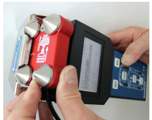
L'alignement de châssis peut être si facile : L'inclinomètre CM 09606 est extrêmement pratique.

Ajuster la chute, le carrossage et la chasse: Ceci fonctionne avec l'inclinomètre CM 09606 de ROMESS de façon extrêmement rapide et simple. Le niveau du véhicule est mesuré via la position des bras oscillants auprès de l'essieu avant et auprès des arbres d'entraînement de l'essieu arrière. L'affichage est montré avec haute précision sur un écran digital. On peut transmettre les valeurs de mesure par l'intermédiaire d'une station de transmission de données et de charge (accessoire) à un ordinateur d'alignement de châssis. Ici, les valeurs de réglage sont classées aux résultats de mesure corrects.