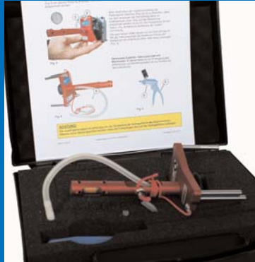
Le dispositif d'ajustage Distronic Plus 09807-10 est fourni dans un coffret pratique.