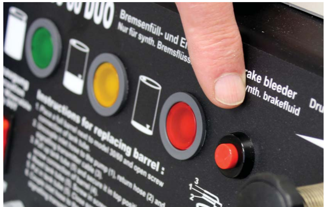
Neu: Durch einen Druck auf den roten Knopf beim S 30-60 DUO ist es nun möglich, besonders wirtschaftlich Bremsflüssigkeit zu wechseln. Damit lässt sich die Restmenge aus einem Gebinde problemlos in ein neues Gebinde pumpen. Das spart Geld.

Sparen auf Knopfdruck - wer will das nicht? Anwendern eines S 30-60 DUO der neusten Baureihe ist dies künftig möglich, denn die Geräte sind darauf ausgelegt, aus Gebinden auch die Restmenge an Bremsflüssigkeit herauszuholen!