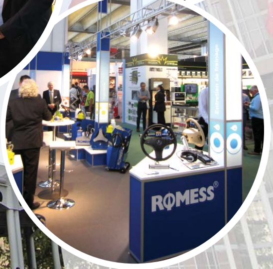
Am ROMESS-Messestand in Halle 8 herrschte stets Hochbetrieb.