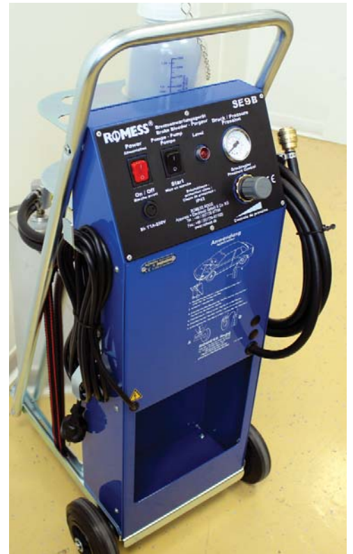
Auf der Basis des SE 8 B, das aus dem Programm genommen wird, bietet ROMESS künftig das SE 9 B an. Es ist mit einem kombinierten Flaschen- und Adapterhalter ausgerüstet (links). Außerdem ist es mit einer optischen Levelanzeige (rechtes Bild - rotes Licht neben dem Manometer) ausgestattet sowie mit einer perfekten Ansaug- und Rücklauf-lanze mit griffigem Kegel.