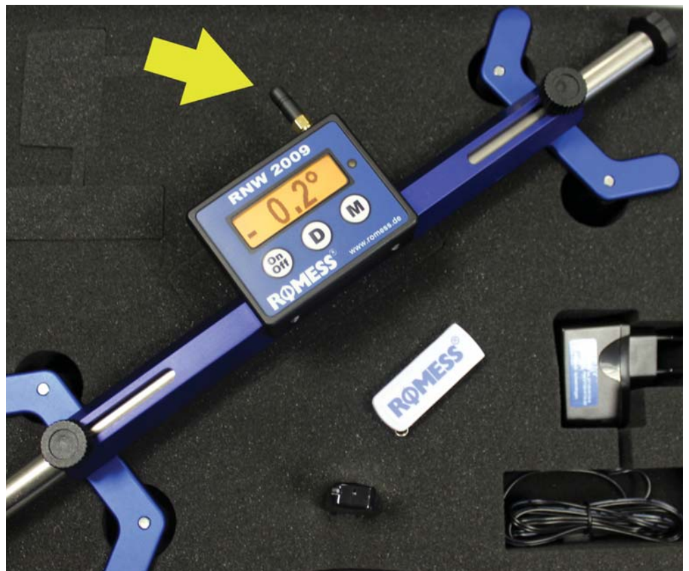
La balance de volant RNW 2009 Wireless (équipée avec antenne - voici flèche jaune) : Les données de mesure sont transmises de façon extrêmement fiable via radio du véhicule à l'ordinateur de mesure d'essieux.