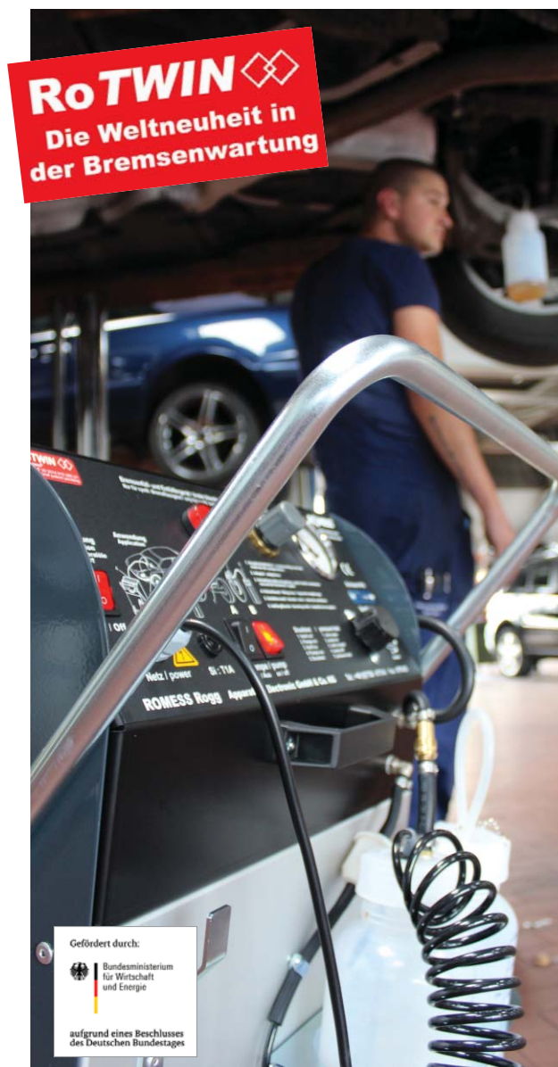
Kraftbolzen beim Bremsenservice: Das SE 30-60 A 10 RoTWIN, hier im Einsatz, garantiert höchste Performance und befördert durch seinen hohen Fließdruck auch aus modernen Bremsanlagen Gas und Schwebeteilchen. Nur dann ist die Sicherheit des Autofahrers auch gewährleistet.

Fast jeder fünfte Personenwagen ist noch mit Mängeln an der Bremsanlage unterwegs. Diese bekannte Quote bestätigt einmal mehr der aktuelle GTÜ-Mängelreport: Fast 18 Prozent der Autofahrer riskieren täglich ihr Leben, weil ihre Bremsanlage nicht richtig funktioniert.