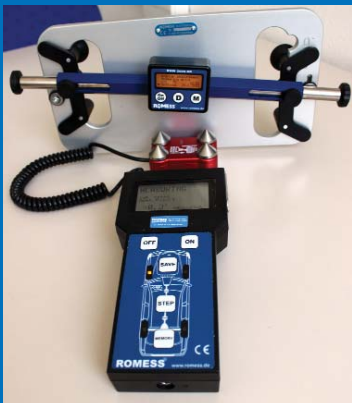
Die Kombination aus Neigungsmesser, Lenkradwaage und Alugrundplatte verleiht Kfz-Werkstätten eine enorme Vielseitigkeit bei der Fahrwerkvermessung.

Gute Aussichten für Automobilbauer, Handel und Werkstätten: Die Neuwagenzulassungen haben zuletzt kräftig angezogen, wozu nicht zuletzt der Privatmarkt beigetragen hat. Das geht aus dem aktuellen Verbraucherindex der Creditplus-Bank hervor. Das Beste: Diese positive Entwicklung soll weiter anhalten. Das Kaufklima der deutschen Verbraucher hat sich der Studie zufolge weiter verbessert. Die Situation ist also günstiger denn je, um in neues, leistungsfähiges Werkstattequipment zu investieren.