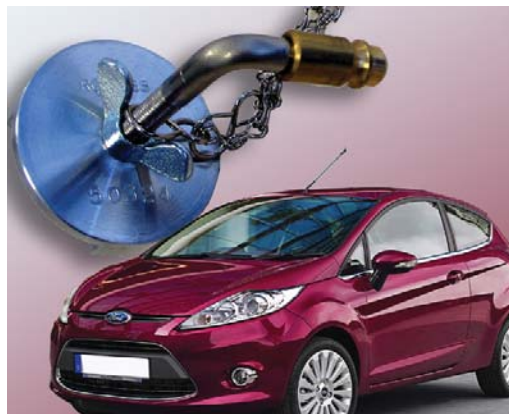
Auf jeden Topf passt ein Deckel und zu jedem Fahrzeug ein Adapter: das Modell 50324 für den Ford Fiesta.

Ein gutes Beispiel für einen unserer sehr gängigen Pkw-Adapter ist der 50324 für den neuen Ford Fiesta.