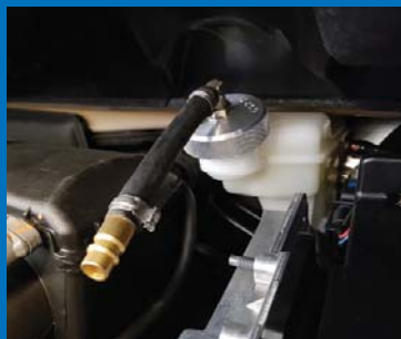
Voiture neuve : C'est très difficile d'arriver au réservoir de compensation. Nouveaux adaptateurs d'angle sont une grande aide.