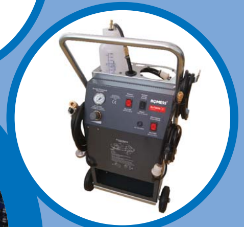
20 A RoTWIN