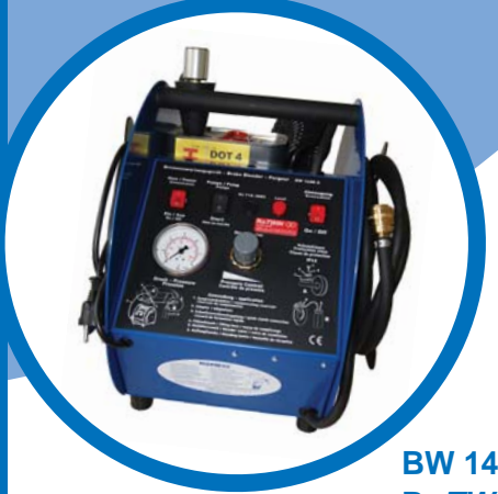
BW 1408 A RoTWIN