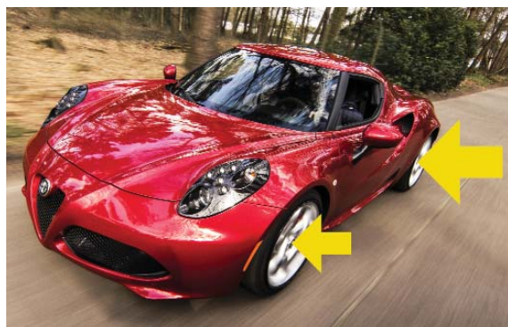
Une pression de freinage irrégulière est un risque pour la sécurité et fait vieillir les pneus avant l'heure.