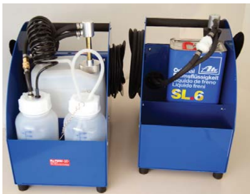
Réservoir (à gauche) ou bien conteneur (à droite) ? - Cette question doit être posée même par des intéressés dans le BW 1408 RoTWIN.

sont inclus, ils ne sont seulement facilement à manier, mais ils peuvent aussi être fermés hermétiquement. Ceci est possible grâce à un cône de fermeture breveté pour conteneurs. Qui utilise des conteneurs, conseille Werner Rogg, doit faire attention qu'ils sont conservés pour une période maximum de six mois.