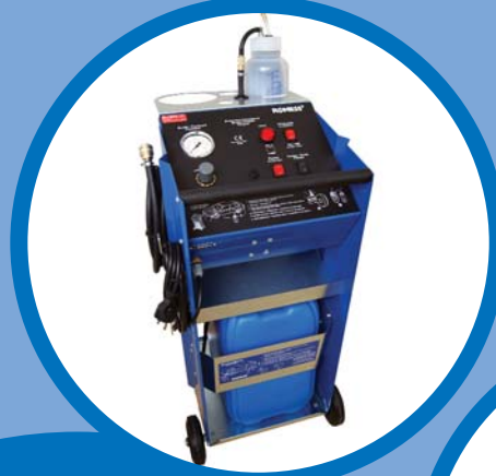
22 A RoTWIN

L'orientation client est l'alpha et l'oméga! Pour cette raison, ROMESS offre dans le secteur de maintenance de freins une vaste gamme de produits. Ici on trouve l'appareil adéquat pour tout besoin. Non seulement nos appareils "classiques" sont intéressants ! Voilà notre liste d'appareils: