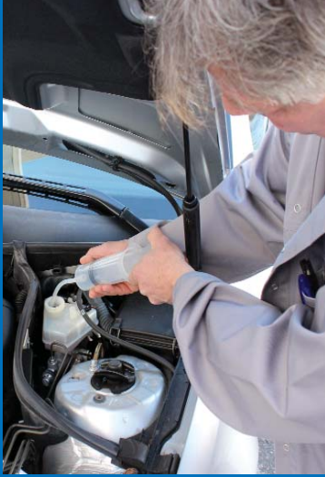
Sipsak dengeleme haznesi bosaltildi.