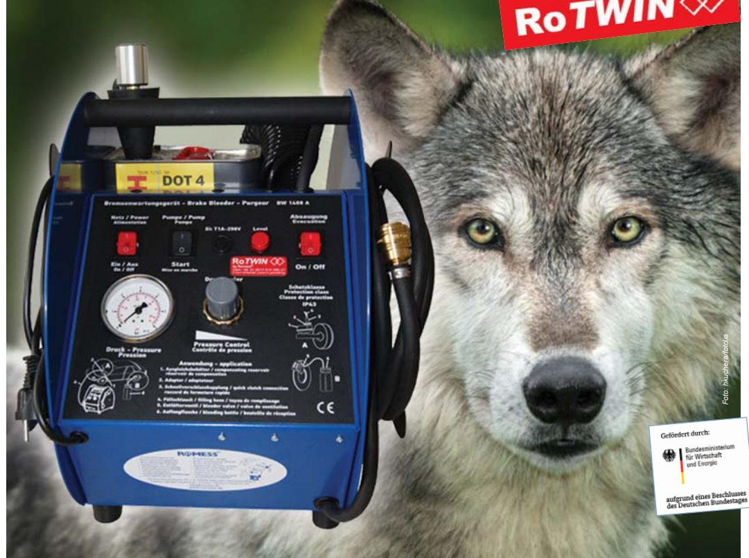
Mobil fren bakım cihazı BW 1408 A RoTWIN'i görenler onu ister istemez küçümsüyorlar. Kompakt cihazın içerisinde bulunan RoTWIN- teknoloji ile çift silindirdi pompların dizginlenemeyen gücüne sahip.